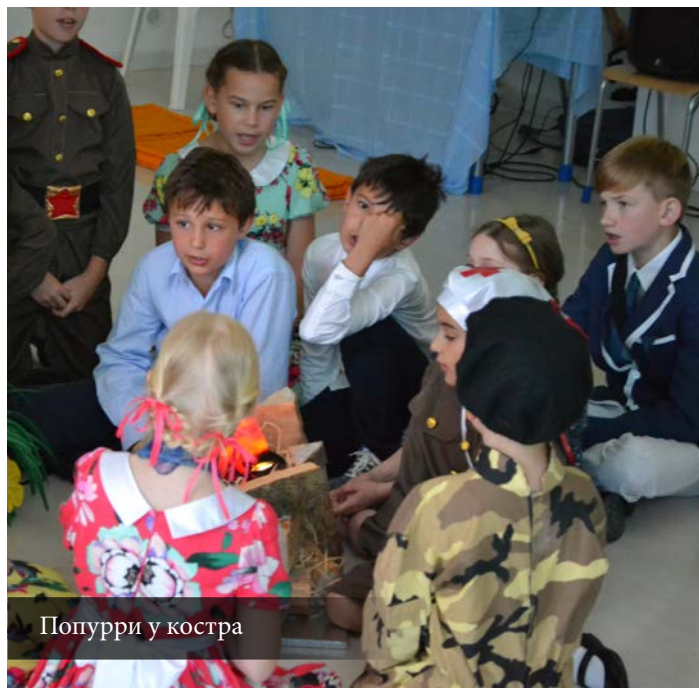
Попурри у костра