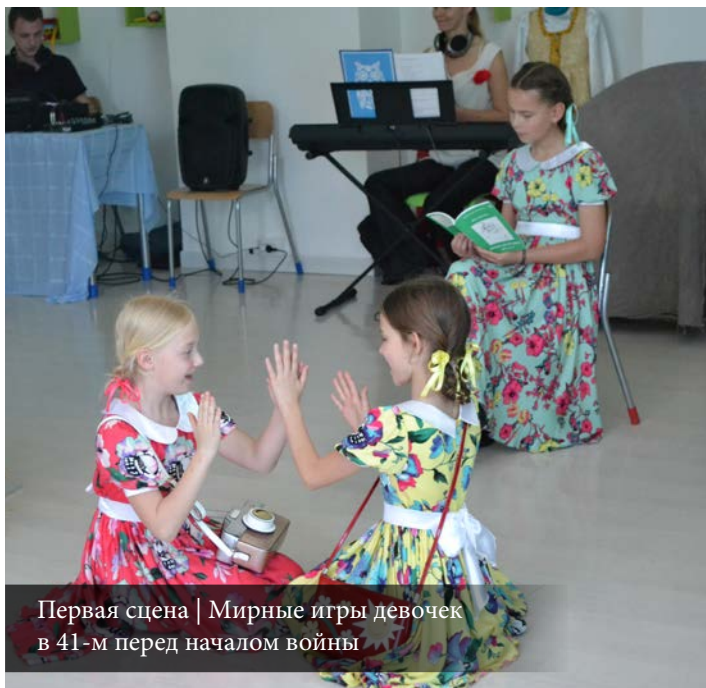
Первая сцена | Мирные игры девочек в 41-м перед началом войны