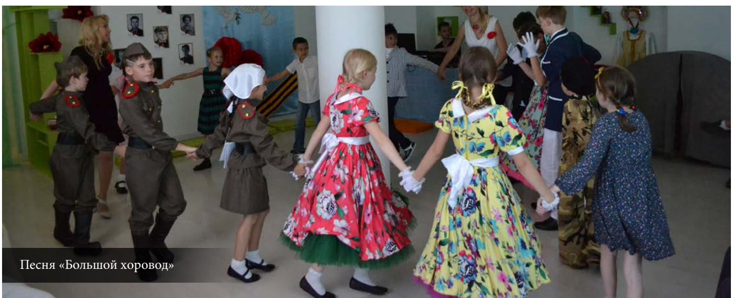
Песня «Большой хоровод»

Вы правы, наш учебно-образовательный центр был основан не так давно. Но уже заслужил внимание и высокие оценки со сто-